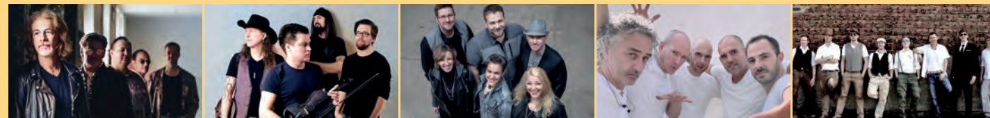
The Quinns Garden of Delight Noizebox Orange Banjoory