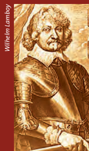
Illustration: www.raut.de · Gestaltung: www.upf.de

Während des Dreißigjährigen Krieges (1618–1648) belagerten kaiserlich-habsburgische Truppen unter der Führung von Wilhelm Lamboy die hoffnungslos überfüllte Stadt Hanau. Fast ein Dreivierteljahr dauerte diese Blockade, bis Landgraf Wilhelm V. von Hessen-Kassel im Bündnis mit schwedischen Truppen am 13. Juni 1636 die Stadt befreite.