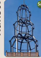
5a Turmhaube Alte Johanneskirche, 2012 Johanneskirchplatz