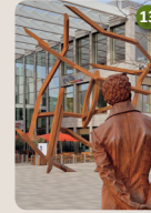
13 Moritz Daniel Oppenheim-Denkmal „Moritz und das tanzende Bild“ Robert Schad | Pascal Coupot, 2015 Freiheitsplatz