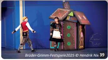
Brüder-Grimm-Festspiele2025 39