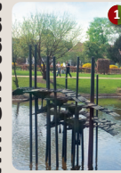
1 Die sechs Schwäne und ihre Schwester Albrecht Glenz, 1983 | 2014 Schlossgartenweiher Ausgangspunkt Hanauer Märchenpfad