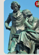
18 Brüder Grimm-Nationaldenkmal Syrius Eberle, 1896 Neustädter Marktplatz