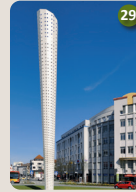
29 Der Entwurf Kazuo Katase, 2008 Kurt-Blum-Platz