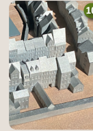
10 Denkmal Hanauer Judengasse Philipp Lach, 2025 Nordstraße