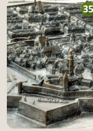
35 Bronzerelief Egbert und Felix Broerken, 2019 Marktstraße/ Ecke Freiheitsplatz