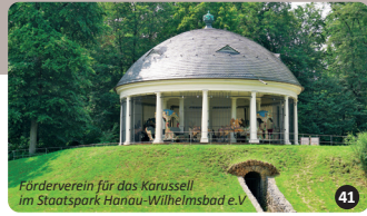
Förderverein für das Karussell im Staatspark Hanau-Wilhelmsbad e.V. 41