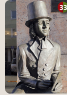
33 Ludwig Emil Grimm-Denkmal Jörg Eyffarth, 2014 Hotel zum Riesen, Heumarkt 8 (Hanauer Märchen- pfad)