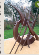
4 Paul Hindemith-Denkmal Faxe M. Müller, 2015 Pestalozzi- | Paul-Hindemith- Musikschule Ramsaystraße 12