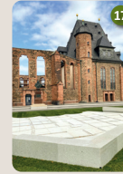
17 Neustadtplan Claus Bury, 2020 Französische Allee