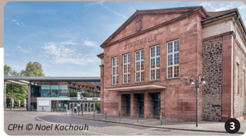
CPH 3