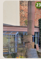
23 Mahnmal zum 19. März 1945 Walter Kromp, 1987 Familienakademie Kathinka-Platzhoff- Stiftung Französische Allee