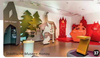
Städtische Museen Hanau 37