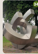
34 Europa Claus Bury, 2001 Grünanlage West- bahnhof